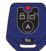
Controle Sensor de Presença CR955 G2