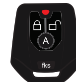
Controle Anti-clonagem CR941 RC